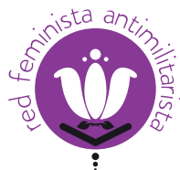
Ilustración: Alterna. Diseño: Natalia Hernández Osorio

www.redfeministaantimilitarista.org Facebook.com/RedFeministaAntimilitarista Medellín - Colombia 2017