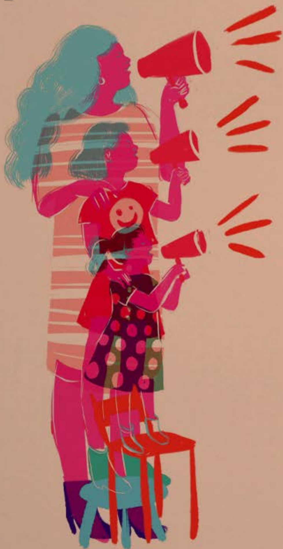
Ilustración: Elizabeth Builes

Compartamos ideas ingeniosas entre mujeres para sacar a los agresores y no dejarlos entrar.