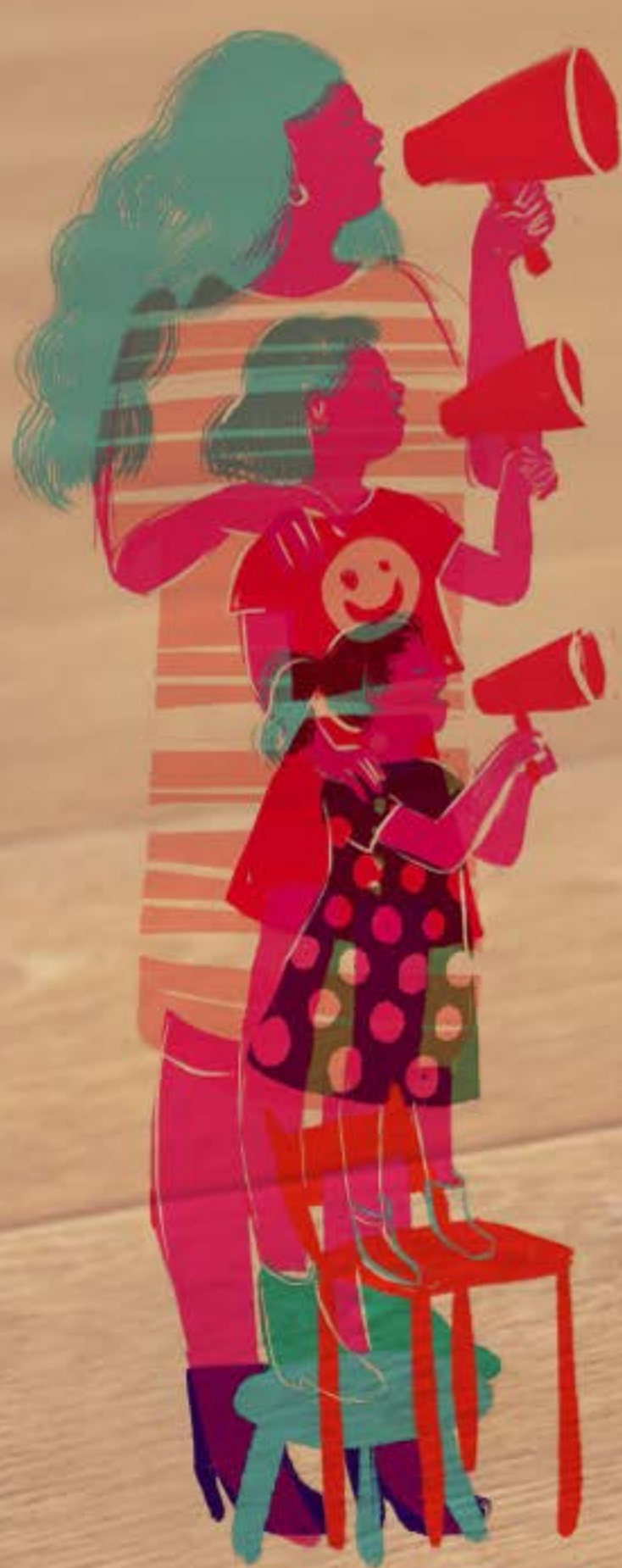
Ilustración: Elizabeth Builes

Busca comunicarte con ella y hazle saber que estás ahí si requiere ayuda.